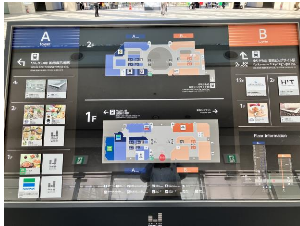
《建物案内図》左がA棟、右がB棟